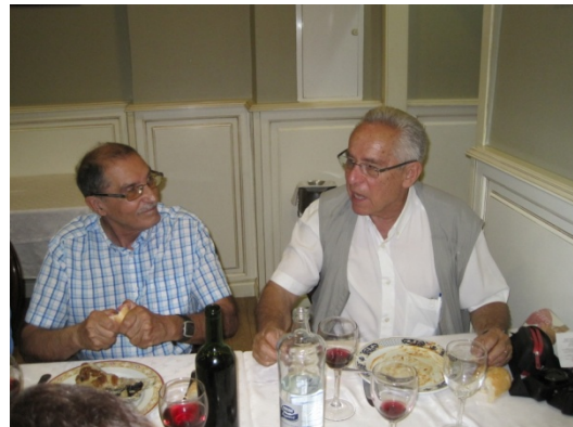
Burguillo y Guevara