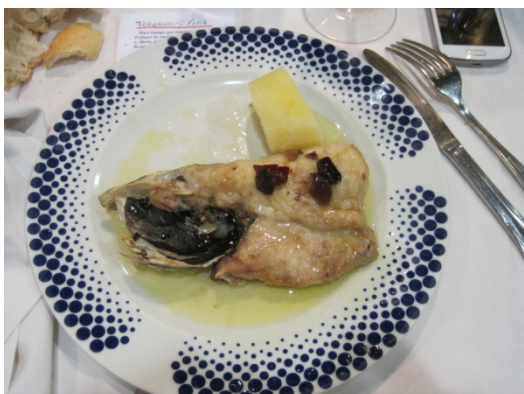
Cogote de merluza a la bilbaína