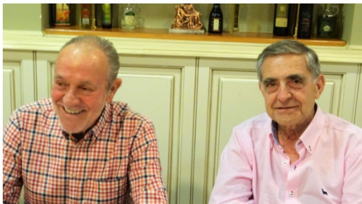
Dominguez y Becerril